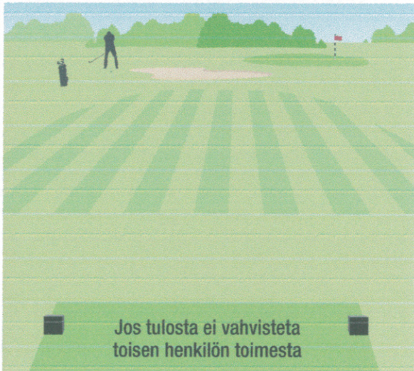
Jos tulosta ei vahvisteta toisen henkilön toimesta