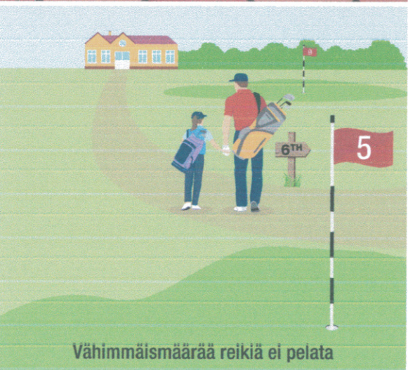
Vähimmäismäärää reikiä ei pelata