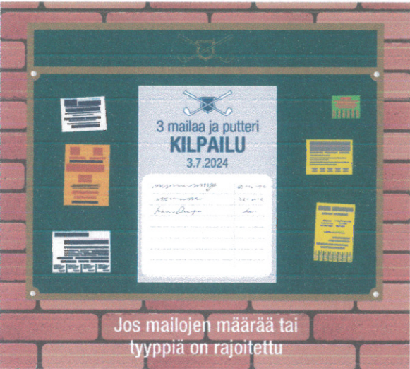
Jos mailojen määrää tai tyyppiä on rajoitettu