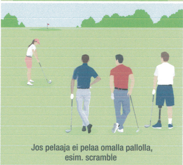
Jos pelaaja ei pelaa omalla pallolla, esim. scramble